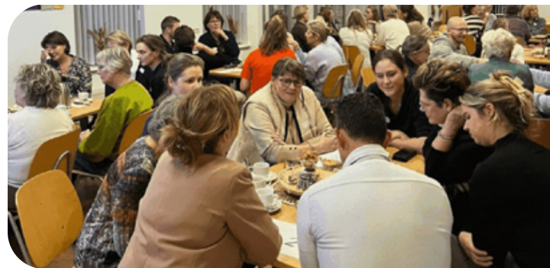
Kick-off van het OncologieZorgnetwerk Heerenveen.

Verder heeft de projectleiding Versterken organisatie eerstelijns nog steeds een trekkersrol in het fundament Versterken eerstelijns van het FrIZA.