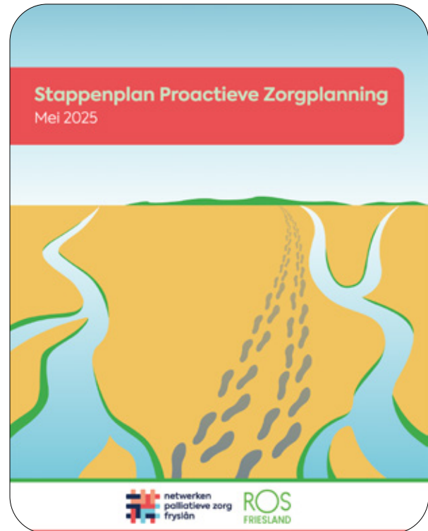
Het (vernieuwde) stappenplan Proactieve Zorgplanning

We hebben samen met de netwerken Palliatieve Zorg Fryslân (NPZF) een (vernieuwd) stappenplan Proactieve Zorgplanning opgezet, deze is hier te vinden. Dit stappenplan is door alle bij NPZF aangesloten deelnemende organisaties gedragen en vastgesteld. De subsidie 'Samenwerken in de Palliatieve Zorg' is helaas afgewezen door ZonMW. De bijbehorende genoemde activiteiten zijn dus niet uitgevoerd. Wel zijn lokaal acties ondernomen om de samenwerking te verbeteren, bijvoorbeeld door Sichtpunt uit te nodigen voor de netwerkbijeenkomst in Noordoost-Friesland.