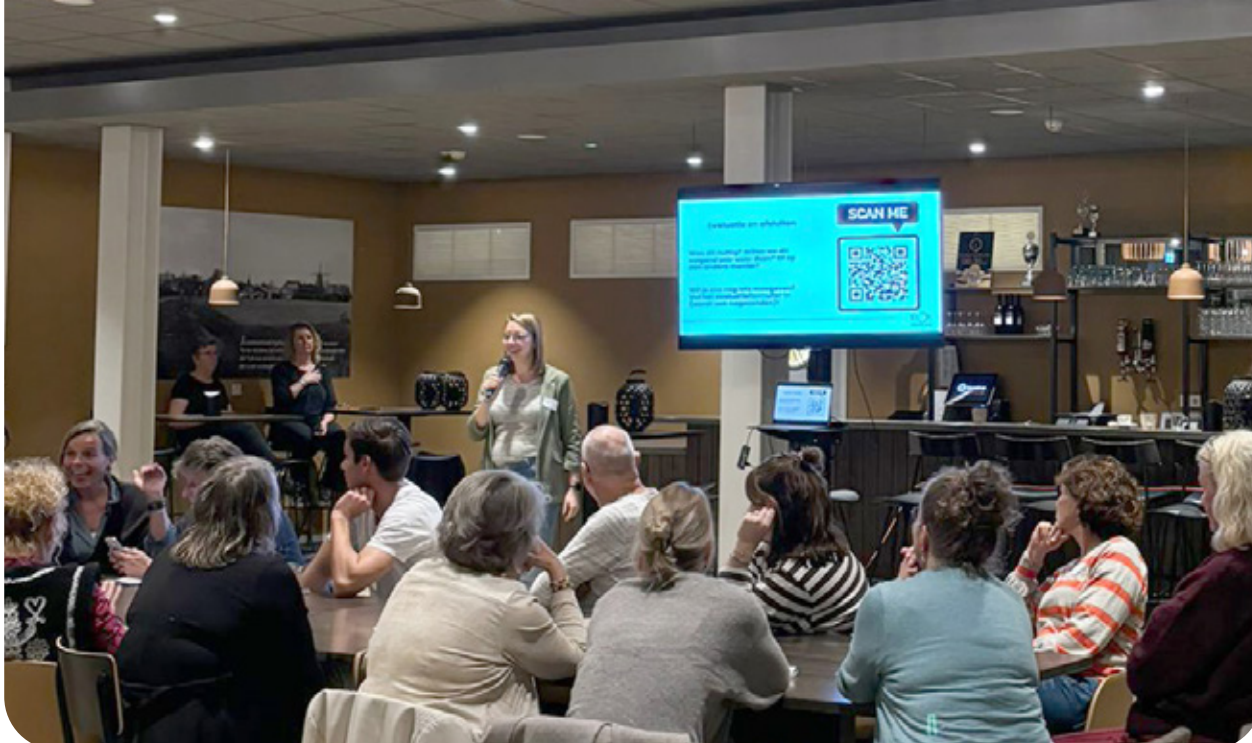
Netwerkbijeenkomst in Noordoost.