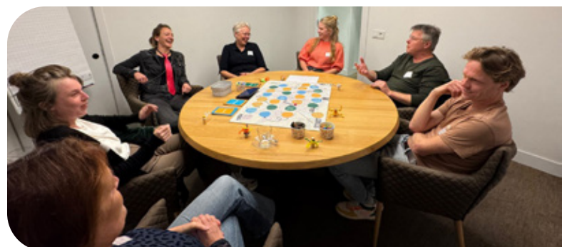
Een serious game tijdens de net werk bijeenkomst in Sneek.

werkers en welzijnscoaches werkzaam in Sneek waren uitgenodigd. De professionals hebben dankzij het spelen van een serious game, ontwikkeld door kernteam Sneek, veel van elkaars werkgebied geleerd. Dit zal bijdragen aan een nog effectievere samenwerking in Sneek.