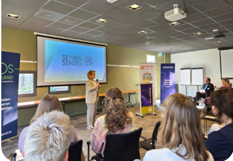
Het Geboortezorgsymposium Noord-Nederland 2025